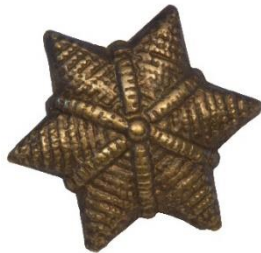
Variant # 4, Forside Dimension, Ø 12 mm