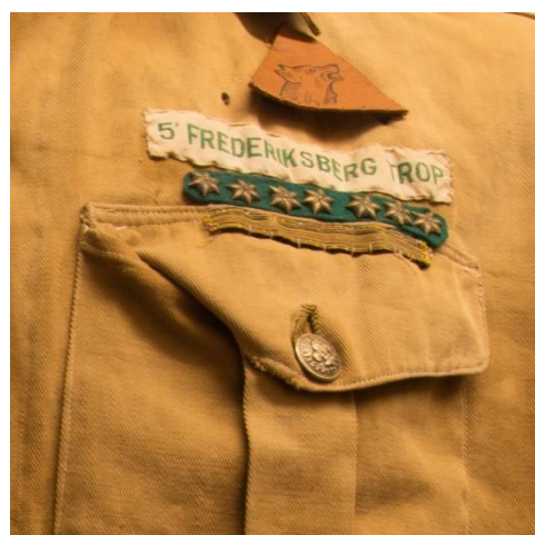
Eksempel på årstjerner over venstre brystlomme. Burde have været en kombination af én stor og flere små stjerner

Nedenfor vises en række af de varianter af de årstjerner, der udkom i denne periode. Der er formentlig andre varianter, end dem der vises her. Jeg modtager meget gerne oplysninger om uniformer med denne type årstjerner.