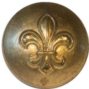
Variant # 2, Forside Dimension: Ø 13 mm