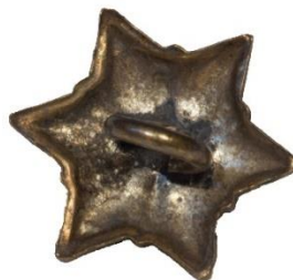
Variant # 4, Bagside