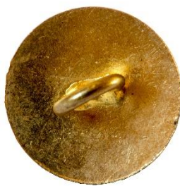
Guld, Variant # 3, Bagside Flad bagside