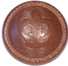
Variant # 6, Forside Ø: 19 mm, Brun Plastik