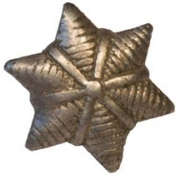
Variant # 2, Forside Dimension, Ø 12 mm