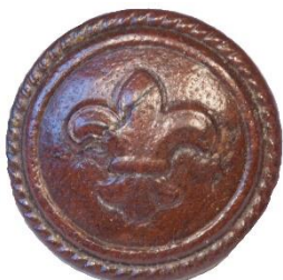
Variant # 3, Forside Ø: 17 mm, Brun Læder