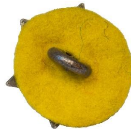
Variant # 3, Bagside Gul filt-ulv