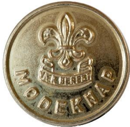
Sølv, Variant # 3, Forside, stor lilje Dimension, Ø: 17 mm