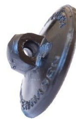
Variant # 10, Bagside Knap til påsyning