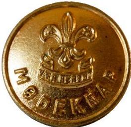
Guld, Variant # 2, Forside, stor lilje Dimension, Ø: 17 mm