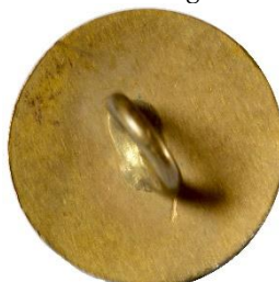
Bronze, Variant # 3, Bagside Flad bagside