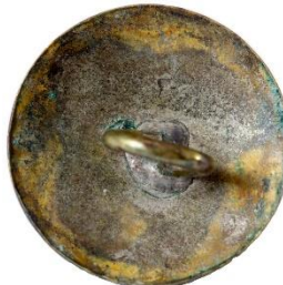
Bronze, Variant # 2, Bagside Let buet bagside