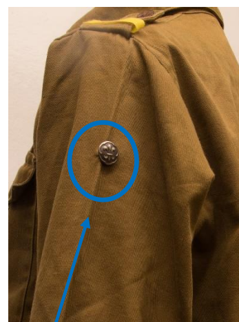
Eksempel på uniform med rekrutmærke, 2. klasseprøve og 1. klasseprøve

I Spejderbogen fra 1918 og 1919 anføres det, at rekrutter ikke har emblem. Det skal hertil bemærkes, at denne bog ikke specifikt er rettet mod DDS, men er en generel beskrivelse af spejderlivet.