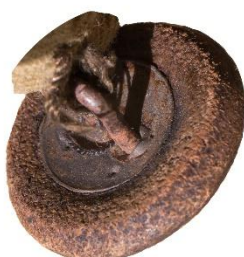
Variant # 1, Bagside Øjet sidder i metalhæfte