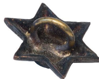
Variant # 3, Bagside