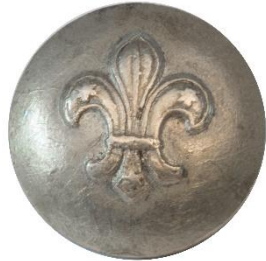
Variant # 3, (1926), Forside Dimension, Ø: 13 mm