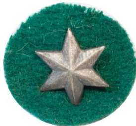
Variant # 5, Forside Dimension, Ø 12 mm