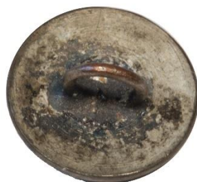
Variant # 3, Bagside Flad bagside