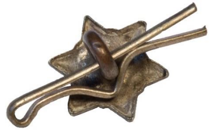
Variant # 2, Bagside