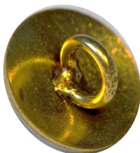
Variant # 4, Bagside Let buet bagside