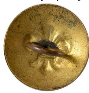
Variant # 3, Bagside Skålformet bagside