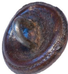
Variant # 3, Bagside Øjet sidder i læder