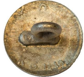
Variant # 2 Bagside, svag buet m. indskript