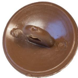
Variant # 7, Bagside Knap til øjefæste