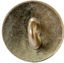
Sølv, Variant # 3, Bagside Flad bagside