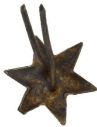
Variant # 5, Bagside