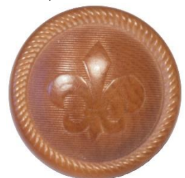
Variant # 2, Forside Ø: 16 mm, Brun Plastik/bakelit