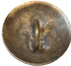
Variant # 1 Bagside, skålformet