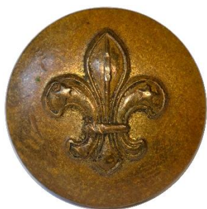
1. udgave, 1931. Forside. Dimension: Ø 13 mm

Mærket er i øvrigt identisk med PF/korporalknapperne, bortset fra at tropsudmærkelsestegnet er forgyldt, mens PF/korporalknapperne er i hvidt metal. Mærket ses nogle gange båret på grønt underlag, selvom dette ikke fremgår af reglementerne.