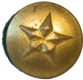
Guld, Variant # 1, Forside Ø: 14 mm, lille stjerne