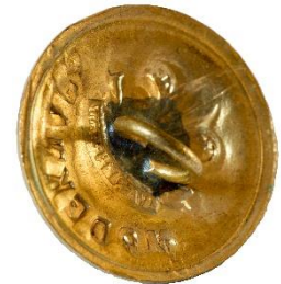
Guld, Variant # 1, Bagside Skålformet bagside