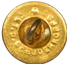
Variant # 1, Bagside Flad m. fordybning og indskript.