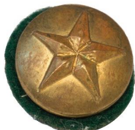
Guld, Variant # 5, Forside Ø: 14 mm, stor stjerne