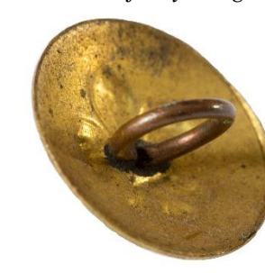
Variant # 3, Bagside Skålformet bagside