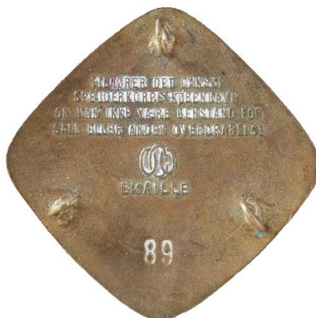
1. udgave, bagside Tekst: OCO, EMAILLE