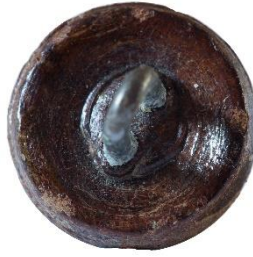
Variant # 7, Bagside Øjet sidder i læder