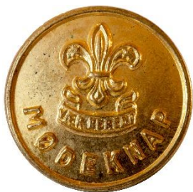
Guld, Variant # 3, Forside, stor lilje Dimension, Ø: 17 mm