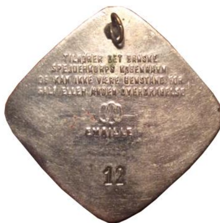
1. udgave, bagside. Forniklet Tekst: OCO, EMAILLE