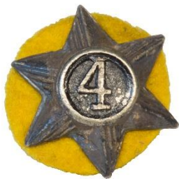
Variant # 3, Forside Ø: 16 mm, sort baggrund