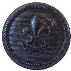
Variant # 10, Forside Ø: 16 mm, Sort Plastik (Søspejd)