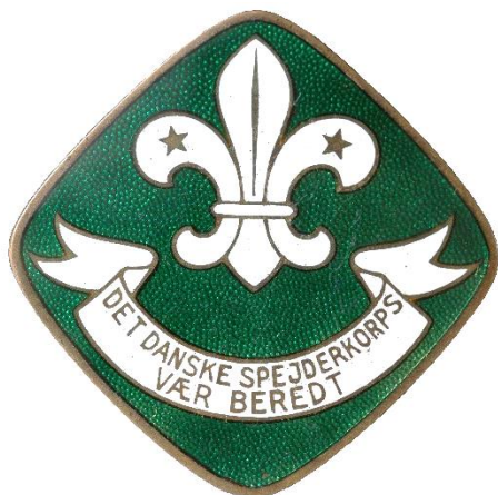
1. udgave, forside. 1926 Tekst i bånd: "N" over "V"