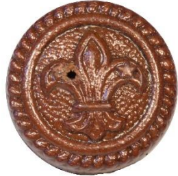
Variant # 7, Forside Ø: 17 mm, Brun Læder