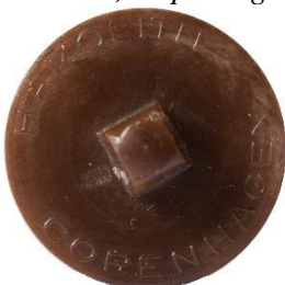
Variant # 4, Bagside Knap til påsyning. Inskription: Hamolith, Copenhagen