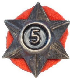
Variant # 5, Forside Ø: 16 mm, sort baggrund