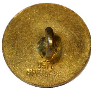
Bagside, bemærk tekst