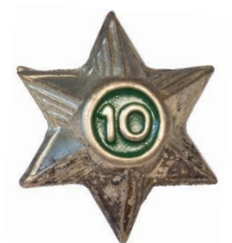
Variant # 1, Forside Ø: 18 mm, grøn baggrund