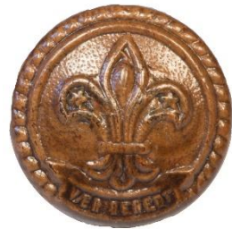
Variant # 9, Forside (Vær Beredt) Ø: 17 mm, Brun Læder