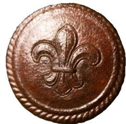
Variant # 5, Forside Ø: ? mm, Brun Læder