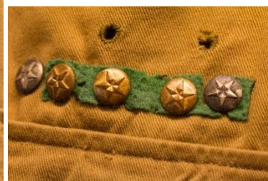
Eksempel på guld- og sølvstjerner på grønt underlag. Nærbillede

I 1937 15 ændres årsstjerneerne på ny. Der indføres 6 takkede hvide metalstjerner med årstal anført på sort baggrund. Stjerneerne bæres på venstre lommeclap på farvet stofunderlag (gul for ulve, grøn for spejdere og rød for rovere). Spejdere bærer endvidere på gult underlag deres ulvestjerner, og rovere bærer deres ulve- og spejderstjerner på farvet underlag.