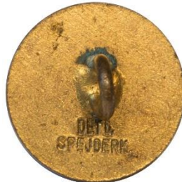
Variant # 2, Bagside Flad bagside m. indskript.