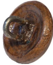
Variant # 9, Bagside Øjet sidder i læder