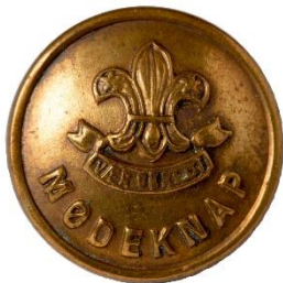
Bronze, Variant # 1, Forside, lille lilje Dimension, Ø: 17 mm

Ingen af knapperne er med inskription på bagsiden (indregistrerede), hvorfor alle formodes at være senere end 1926 (og 1931, se ovenfor vedr. trospudmærkelsestegn). Ud fra de modtagne samlinger mv., skønnes det, at skiftet mellem variant # 1 og # 2, sker i 50'erne.