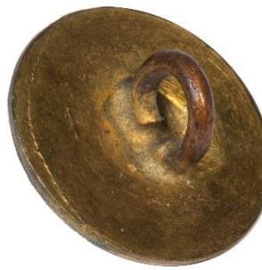
Variant # 2, Bagside Flad m. fordybning