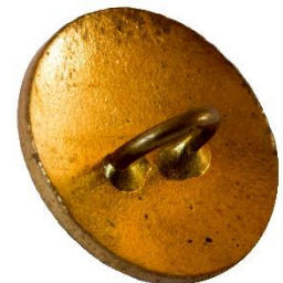
Guld, Variant # 2, Bagside Let buet bagside