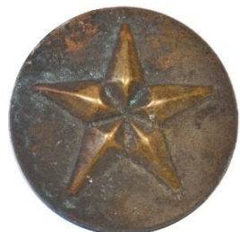
Guld, Variant # 3, Forside Ø: 14 mm, stor stjerne