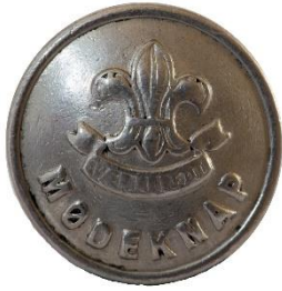
Sølv, Variant # 1, Forside, lille lilje Dimension, Ø: 17 mm