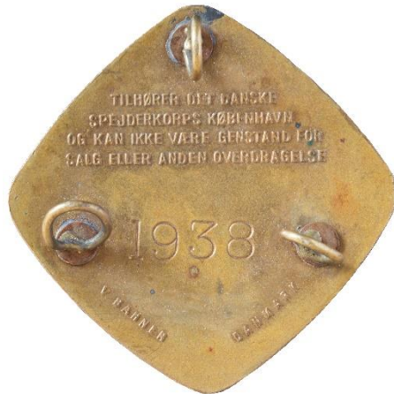
4. udgave, bagside Tekst: V. BAHNER DANMARK