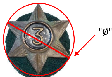
Mål af dimension