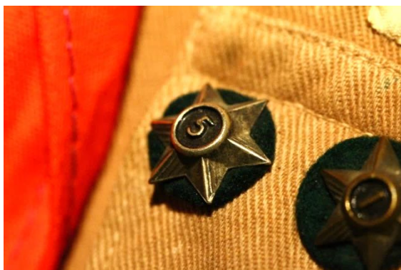
Eksempel på årsstjerner med grønt underlag. Burde have været to forskellige farver. Roveruniform