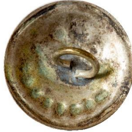
Sølv, Variant # 1, Bagside Skålformet bagside