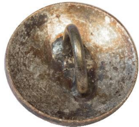
Variant # 4 Bagside, svag buet