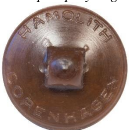
Variant # 3, Bagside Knap til påsyning. Inskription: Hamolith, Copenhagen