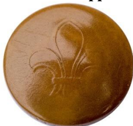
Variant # 1a, Forside Ø: 17 mm, Brun Plastik/bakelit