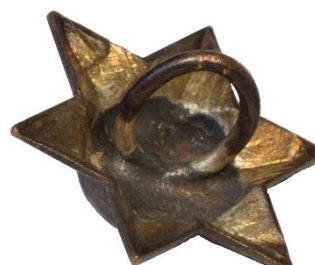
Variant # 2, Bagside