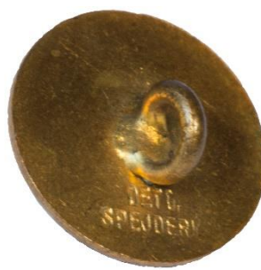
Bagside, Bemærk tekst