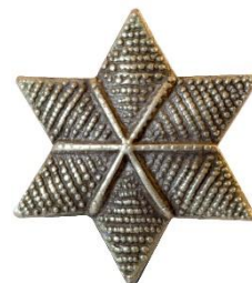
Stor stjerne, Forside Dimension, Ø 17 mm