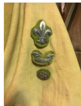
Eksempel på placering af rekrutmærke på venstre ærme

I forbindelse med indførelsen af det nummererede emaljekorpsmærke i 1926 bortfalder rekrutprøvemærket, og er ikke gengivet i reglementet fra 1926 26 .