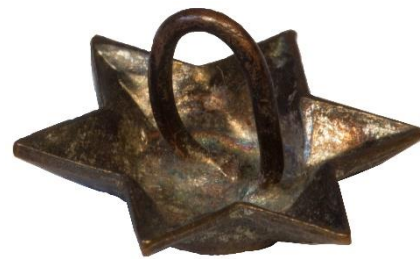
Variant # 1, Bagside