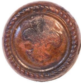
Variant # 6, Forside Ø: 17 mm, Brun Læder