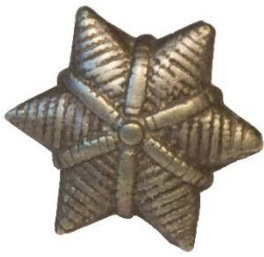
Variant # 1, Forside Dimension, Ø 12 mm