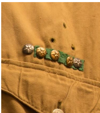
Eksempel på guld- og sølvstjerner på grønt underlag