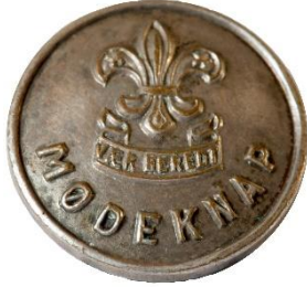
Sølv, Variant # 2, Forside, stor lilje Dimension, Ø: 17 mm