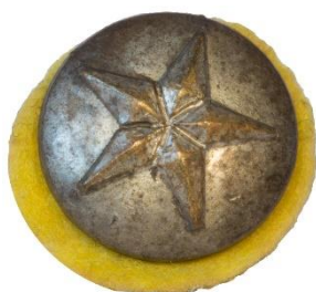
Sølv, Variant # 3, Forside Ø: 14 mm, stor stjerne