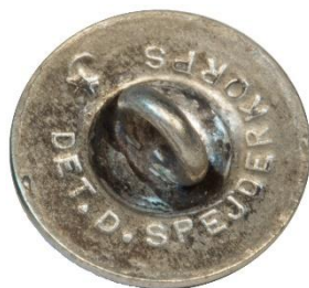
Variant # 1, Bagside Flad m. fordybning og indskript.