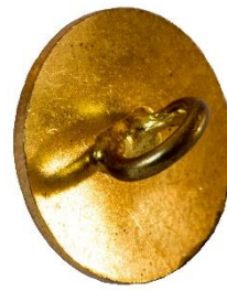
Guld, Variant # 3, Bagside Flad bagside