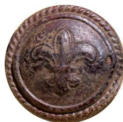
Variant # 2, Forside Ø: 16 mm, Brun Læder