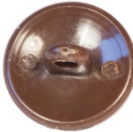
Variant # 8, Bagside Knap til øjefæste