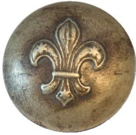
Variant # 1, Forside Dimension, Ø: 13 mm