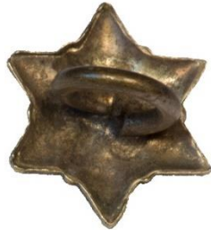
Variant # 1, Bagside