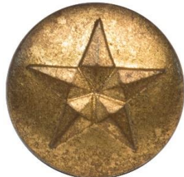
Guld, Variant # 2, Forside Ø: 13 mm, stor stjerne