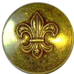
Variant # 4, Forside Dimension: Ø 14 mm