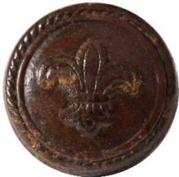
Variant # 8, Forside Ø: 16 mm, Brun Læder