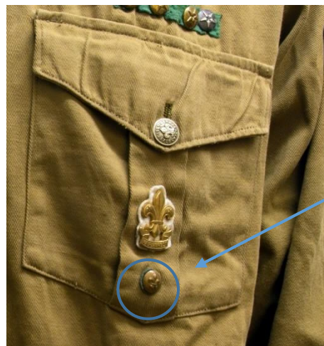
Eksempel på placering af knap. Bemærk, at den har grønt underlag.