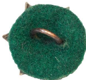
Variant # 2, Bagside Ureglementeret grøn filt