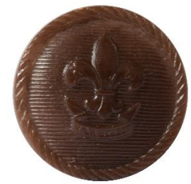
Variant # 4, Forside Ø: 20 mm, Brun Plastik