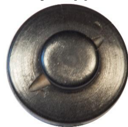
Variant # 9, Bagside Knap til påsyning