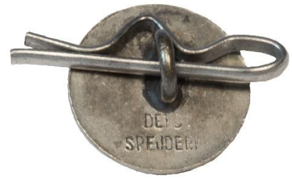
Variant # 3, Bagside Flad bagside m. indskript