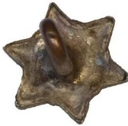
Variant # 2, Bagside