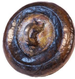
Variant # 6, Bagside Øjet sidder i metalhæfte