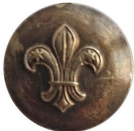
Variant # 5, Forside Ø: ? mm