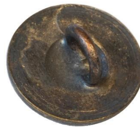
Variant # 4, Bagside Flad m. fordybning