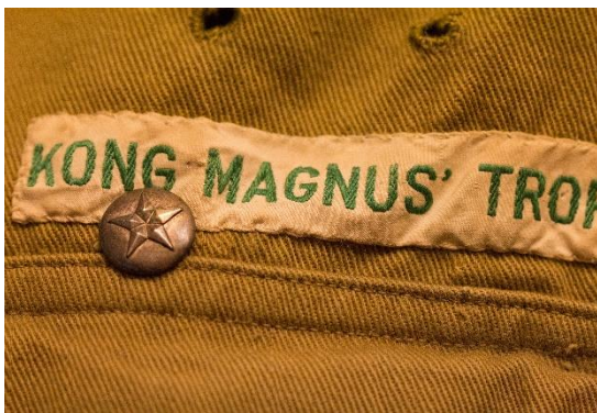
Eksempel på enkelt sølvstjerne # 2 Rester af grønt filt på bagsiden