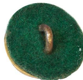
Variant # 5, Bagside Grøn filt-spejder