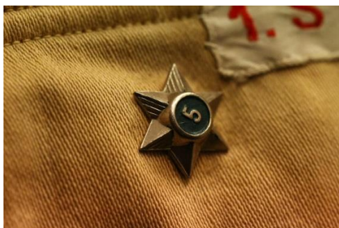
Eksempel på årstjerne med grøn baggrund (spejder) (1944-50)

I 1945 17 meddeles det, at depotet nu har alle årstjerner fra 1-20 år på lager.