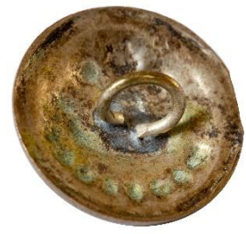
Sølv, Variant # 1, Bagside Skålformet bagside