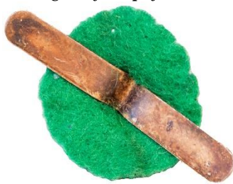
Variant # 2, Bagside Grøn filt-spejder. Splitfæste