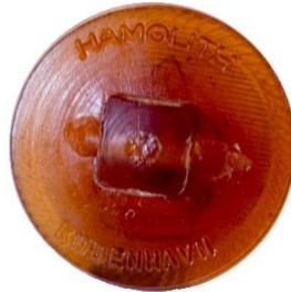
Variant # 5, Bagside Knap til påsyning. Inskription: Hamolith, København