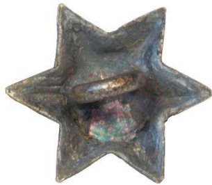
Variant # 3, Bagside