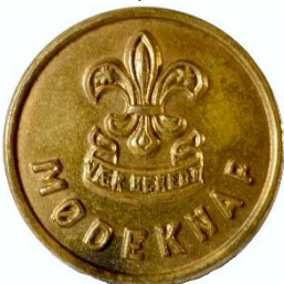
Bronze, Variant # 3, Forside, stor lilje Dimension, Ø: 17 mm