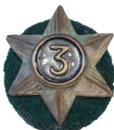
Variant # 1, Forside Ø: 16 mm, sort baggrund

Selvom disse årsstjerner kun blev anvendt i en kortere årrække, er der en række varianter, herunder forskellige taltyper. Alle disse varianter vil ikke blive gengivet her.