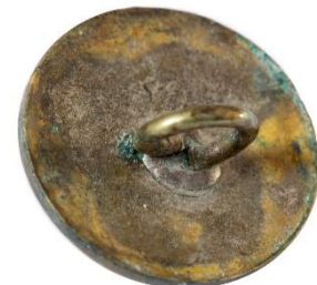
Bronze, Variant # 2, Bagside Let buet bagside