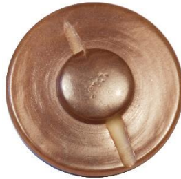
Variant # 6, Bagside Knap til påsyning