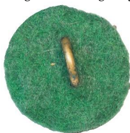
Variant # 3, Bagside Ureglementeret grøn filt