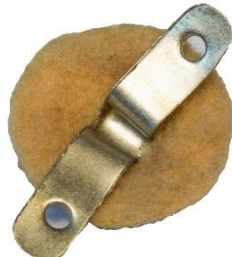
Variant # 4, Bagside Gul filt-ulv. Splitfæste