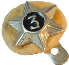
Variant # 4, Forside Ø: 16 mm, sort baggrund