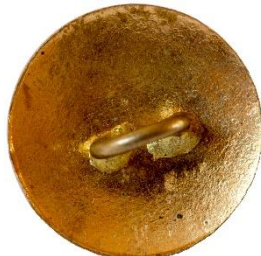
Guld, Variant # 2, Bagside Let buet bagside