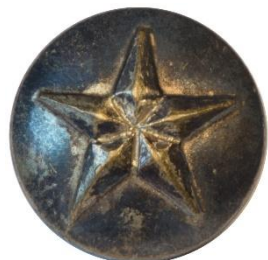
Guld, Variant # 4, Forside Ø: 14 mm, stor stjerne