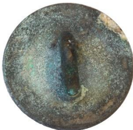
Variant # 3, Bagside Skålformet bagside