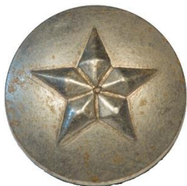
Sølv, Variant # 1, Forside Ø: 14 mm, lille stjerne

I 1926 13 sker der drastiske ændringer i mange mærkers udseende, herunder bliver en del mærker indregistrerede og forsynet med korpsets navn og mærke 14 . Årstjernerne ændrer udseende til en rund hvid metalknap med 5 takket stjerne båret på farvet underlag. Hvert tredje år ombyttes etårsstjernerne med en forgyldt treårsstjerne. Ulve har gult underlag, spejdere grønt underlag og rovere rødt underlag. Rovere har kun stjerner for hvert tredje år de har stået i korpset, der bæres sammen med deres ulve- og spejderstjerner. Også her ses uniforms-eksempler på, at der ikke er sket udskiftning til forgyldte stjerner, således som foreskrevet.