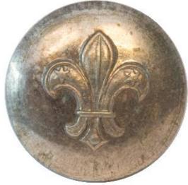
Variant # 2, Forside Dimension, Ø: 13 mm