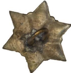
Variant # 3, Bagside