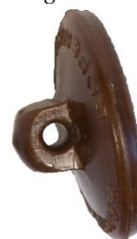
Variant # 3, Bagside Knap til påsyning