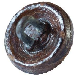
Variant # 7, Bagside Øjet sidder i læder