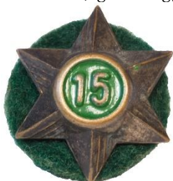
Variant # 2, Forside Ø: 16 mm, mellemgrøn baggrund