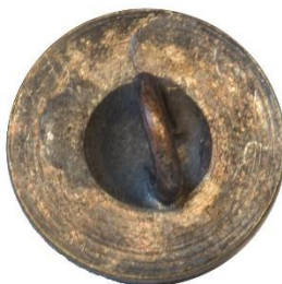
Variant # 4, Bagside Flad m. fordybning