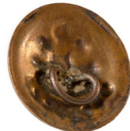
Bronze, Variant # 1, Bagside Skålformet bagside