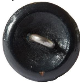
Variant # 4, Bagside Øjet sidder i læder