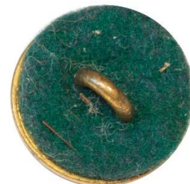
Variant # 1, Bagside Grøn filt-spejder