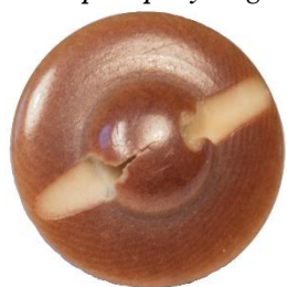
Variant # 2, Bagside Knap til påsyning