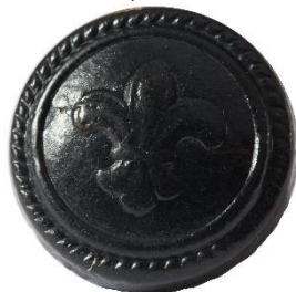
Variant # 4, Forside Ø: 17 mm, Sort Læder (Søspejd)