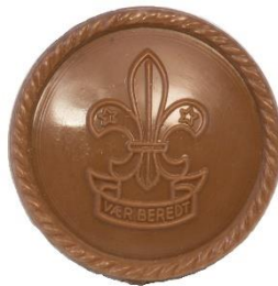
Variant # 7, Forside Ø: 17 mm, Lysbrun Plastik