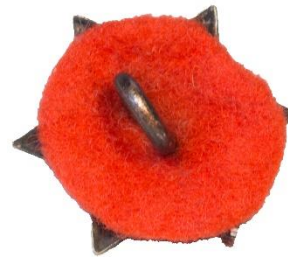
Variant # 5, Bagside Rød filt-rover