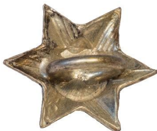
Variant # 1, Bagside