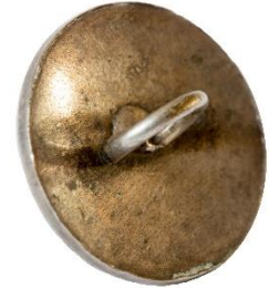
Sølv, Variant # 2, Bagside Let buet bagside