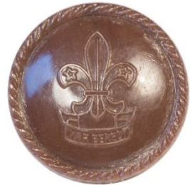
Variant # 8, Forside Ø: 17 mm, Mørkbrun Plastik