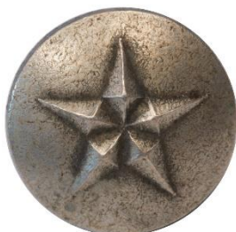
Sølv, Variant # 2, Forside Ø: 13 mm, lille stjerne