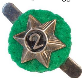
Variant # 2, Forside Ø: 16 mm, sort baggrund