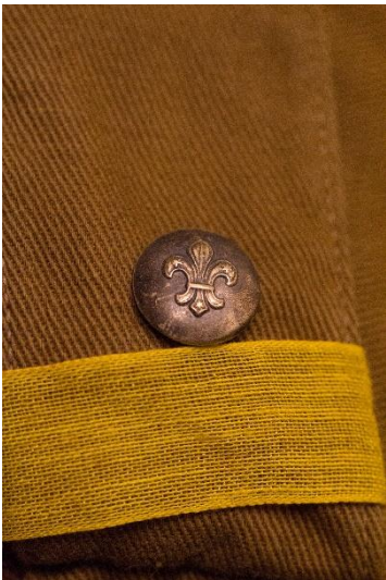
Eksempel på korporalknap # 1 uden underlag