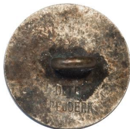
Variant # 2, Bagside Flad bagside m. indskript.