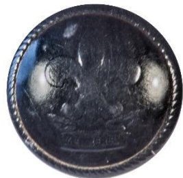
Variant # 9, Forside Ø: 16 mm, Sort Plastik (Søspejd)