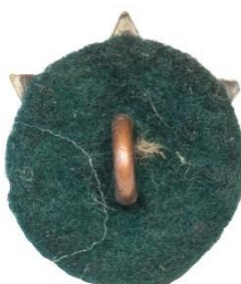
Variant # 1, Bagside grøn filt-spejder