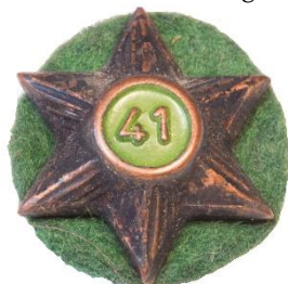
Variant # 3, Forside Ø: 18 mm, lysgrøn baggrund