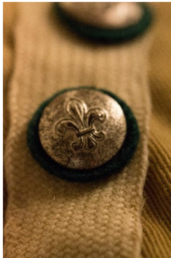
Eksempel på PF-knapper # 3 på grønt underlag

I 1937 34 35 afskaffes knapperne og der indføres hvide snore, 1 cm brede og 10 cm lange, der bæres på venstre brystlomme, henholdsvis en for patruljeassistenter (tidligere korporaler) og to for patruljeførere. Patruljeassistentmærket bæres midt på lommen.