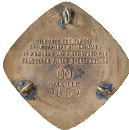
3. udgave, bagside Tekst: OCO, EMAILLE