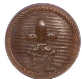
Variant # 3, Forside Ø: 16 mm, Brun Plastik