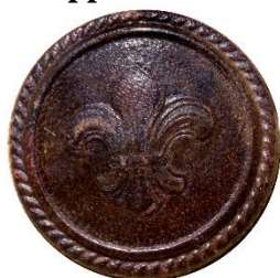
Variant # 1, Forside Ø: 23 mm, Brun Læder