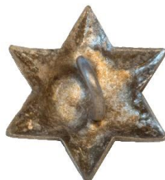
Variant # 1, Bagside