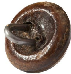
Variant # 8, Bagside Øjet sidder i læder