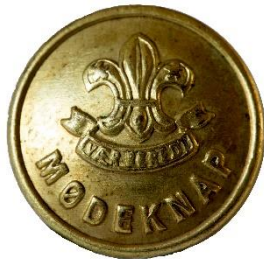
Guld, Variant # 1, Forside, lille lilje Dimension, Ø: 17 mm