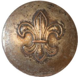
Variant # 4, Forside Ø: 14 mm