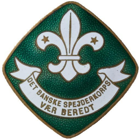
4. udgave, forside Tekst i bånd: "N" over "V"