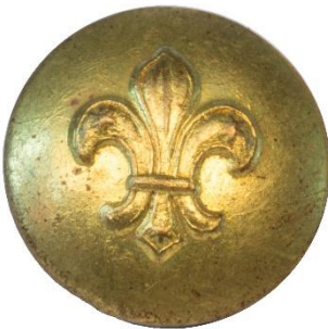
Variant # 3, Forside Dimension: Ø 13 mm