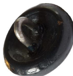
Variant # 4, Bagside Øjet sidder i læder