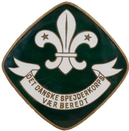
3. udgave, forside. 1950 Tekst i bånd: "S" over "V"