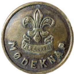
Bronze, Variant # 2, Forside, stor lilje Dimension, Ø: 17 mm