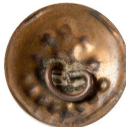
Bronze, Variant # 1, Bagside Skålformet bagside