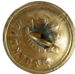
Guld, Variant # 1, Bagside Skålformet bagside