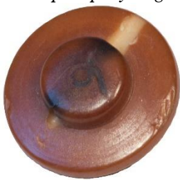
Variant # 1, Bagside Knap til påsyning