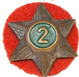
Variant # 4, Forside Ø: 16 mm, grøn baggrund