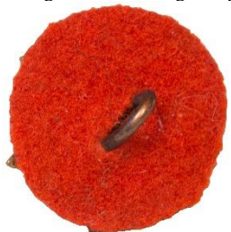
Variant # 4, Bagside Ureglementeret rød filt