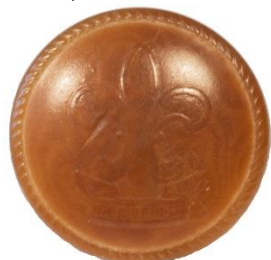
Variant # 1, Forside Ø: 16 mm, Brun Plastik/bakelit