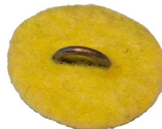
Variant # 3, Bagside Gul filt-ulv