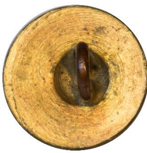
Variant # 2, Bagside Flad m. fordybning