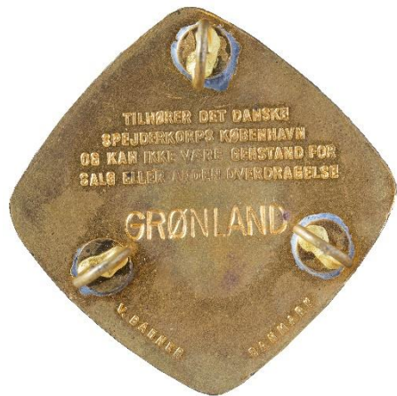
Grønlandsudgave, bagside Tekst: GRØNLAND V. BAHNER DANMARK