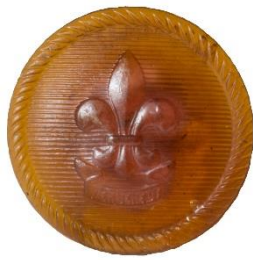
Variant # 5, Forside Ø: 16 mm, Transperant Brun Plastik