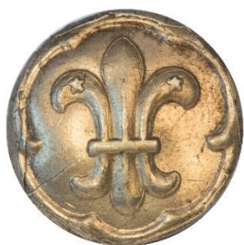
Rekrutmærke 1914-21, Forside Dimension, Ø: 16 mm

Et mærke for rekrutter (spejdere, der ikke har taget 1. eller 2. klasseprøven) blev indført i 1914 21 og beskrevet som en roset på venstre overarm. Samtidig beskrives korporal og patruljefører distinktionen som henholdsvis en/to roset(ter) på skulderstroppen. At det næppe er de samme, fremgår af depotets prisliste fra 1915 22 , hvor emblemerne til PF/korporal betegnes som knapper, mens rekrutmærket fortsat benævnes som en roset.