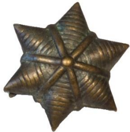
Variant # 3, Forside Dimension, Ø 13 mm