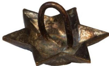
Variant # 5, Bagside