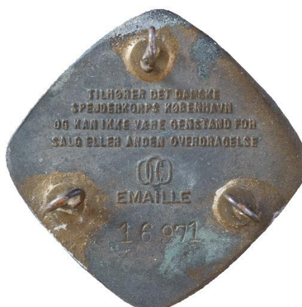
2. udgave, bagside Tekst: OCO, EMAILLE