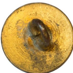
Variant # 5, Bagside Let buet bagside