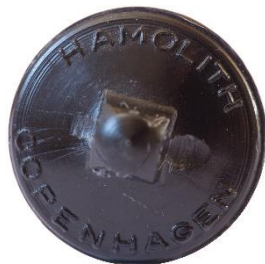
Variant # 10, Bagside Knap til påsyning. Inskription: Hamolith, Copenhagen