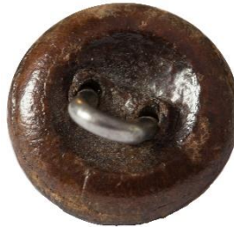
Variant # 8, Bagside Øjet sidder i læder