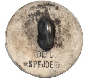
Variant # 3, Bagside Flad bagside m. indskript