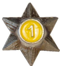
Variant # 1, Forside Ø: 16 mm, gul baggrund - ulv

I 1944 16 sker der en ny ændring, idet stjernerne får tal på farvet bund efter gren, således gul bund for ulve, grøn bund for spejdere og rød bund for rovere. Spejdere og rovere bærer fortsat tidligere erhvervede ulve/spejder årstjerner med farvet bund.