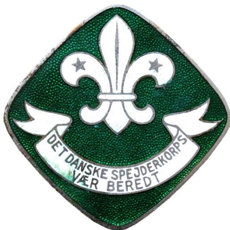
1. udgave variant 1a, forside. 1926 Tekst i bånd: "N" over "V"