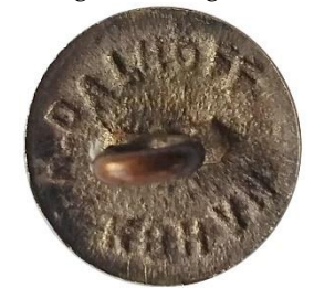
Variant # 5 Bagside, indskript.