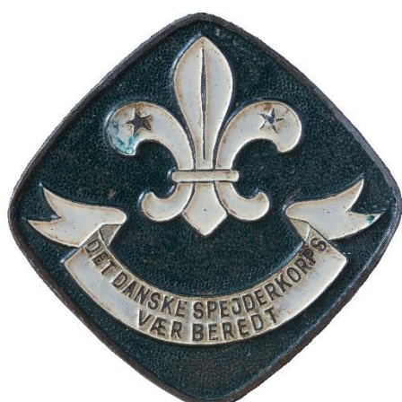
2. udgave (Krigsudgave), forside Tekst i bånd: "S" over "V"