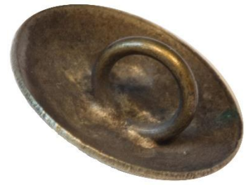
Variant # 1 Bagside, skålformet