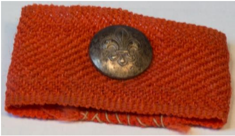
Eksempel på korporalknap # 3 på skuldersløjfe