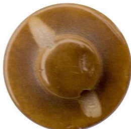
Variant # 1a, Bagside Knap til påsyning