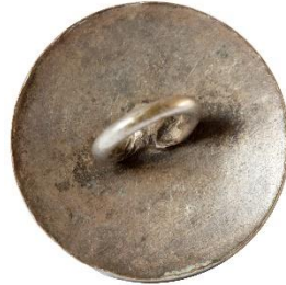
Sølv, Variant # 2, Bagside Let buet bagside